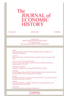
The Journal of Economic History